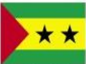
São Tomé e Príncipe